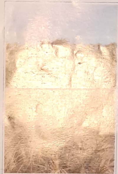
Fig. 1.11 Palmeras Butia paraguayensis en la zona de Cerros Chatos (departamento de Tacuarembó). Las palmeras son quemadas para que el ganado se alimente de los brotes tiernos que nacen luego de esta práctica.

En el Uruguay la red vial carece del desarrollo que tiene en países del primer mundo pero puede considerarse un factor de incidencia en la biodiversidad de algunas zonas del país. Existe un estudio sobre el impacto del tránsito vehicular en una ruta uruguaya (la ruta 9), realizado por la organización Vida Silvestre con el apoyo del Ministerio de Ganadería, Agricultura y Pesca, que resulta muy ilustrativo. El estudio se realiza relevando cuáles y cuántos vertebrados aparecen atropellados a lo largo de casi 230 kilómetros de carretera en el transcurso del año 1997. Los resultados arrojaron la cifra de aproximada de 1800 mamíferos siendo los animales más perjudicados los zorrillos, seguidos de la comadreja mora y bastante por debajo los zorros, armadillos y el apereá. Del listado de especies encontradas muertas llama la atención algunas especies menos frecuentes de observar en una ruta como el guazubirá y el lobito de río.