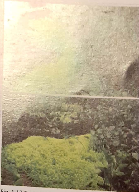
Fig. 1.13 Como consecuencia de la eutrofización, una población de Myriophyllum (cola de zorro, en color verde más claro) ha experimentado un rápido crecimiento llegando en algunos sectores a cubrir casi totalmente la superficie del agua.