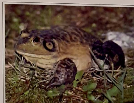
Fig. 1.14. Lithobates catesbeiana , rana toro: una especie con gran potencial invasor para el Uruguay.

Las especies invasoras son especies exóticas que liberadas intencional o accidentalmente, se propagan sin control y ocasionan disturbios ambientales como modificaciones en la composición, estructura y procesos de los ecosistemas (de Porter 1999)".