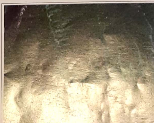
Fig. 1.7. Deforestación en Amazonia, en este caso desde un satélite. Las carreteras y ríos en el bosque siguen un patrón característico flameante "espaldas de pez".

Ningún disco duro, ni aún el de las computadoras más potentes, guarda tanta información trascendente como la información genética escrita en el genoma de los seres vivos. Si en forma negligente se provoca y permite que año a año desaparezcan especies, la mayoría de las cuales no se conocen ¿No tendremos demasiado para perder? ¿No estará la cura o tratamiento de otras enfermedades esperando ser descubierta en alguna especie conocida o desconocida? ¿No estaremos arriesgando incluso la viabilidad de la vida tal como la conocemos hoy en el planeta?