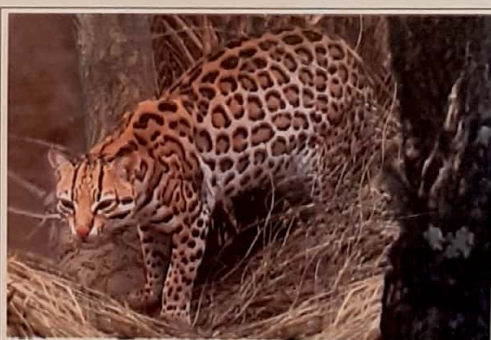
Fig. 1.8. Una especie probablemente extinta en los ambientes naturales del Uruguay: Leopardus pardalis mitis , ocelote.

Existen estimaciones, como las de WILSON (1987) que señalan que la pérdida de diversidad específica atribuible a la deforestación de la selva tropical es alarmante. Según las mismas, la tasa natural de base de extinción que existía antes de que existiera el ser humano ha aumentado unas 10.000 veces.