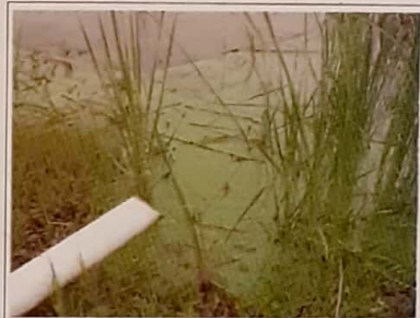
Fig. 1.12. Floración de Microcystis , favorecida por la eutrofización provocada por el desague en el cuerpo de agua (departamento de Maldonado).